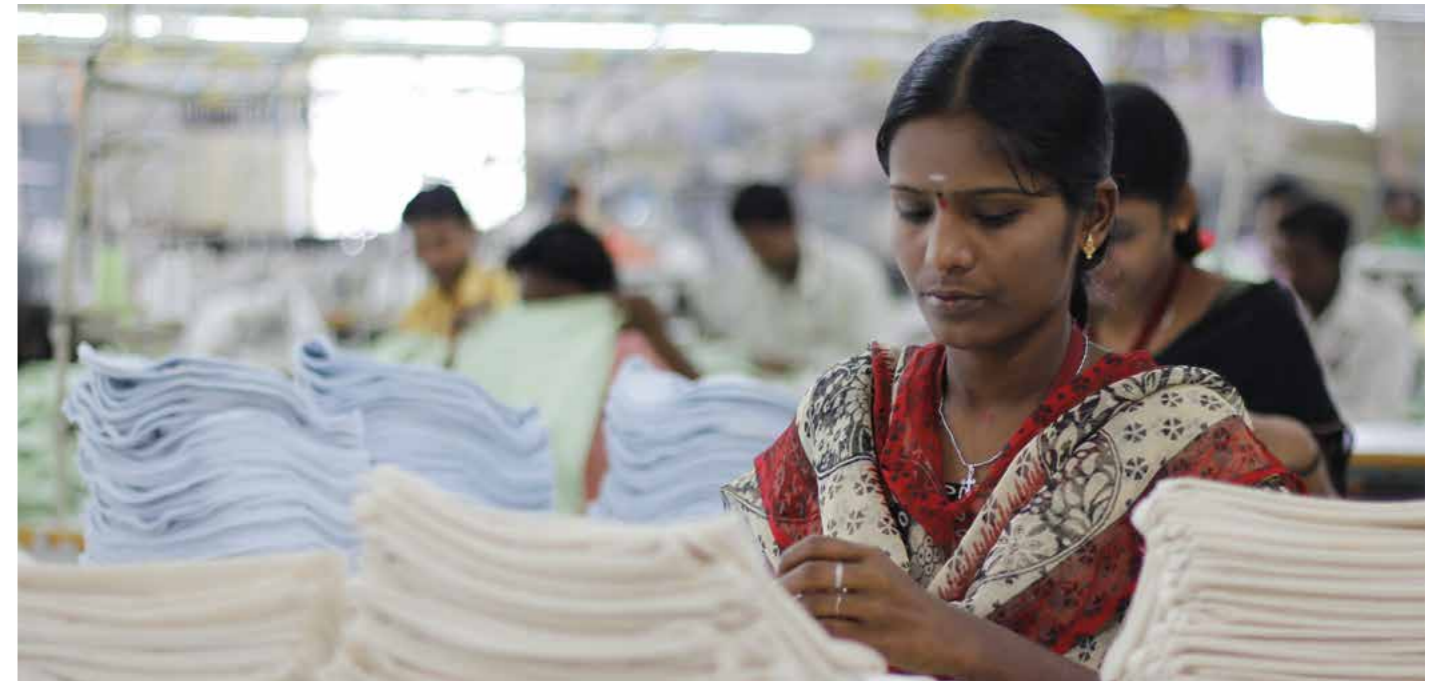
Sichere und saubere Arbeitsplätze sind noch lange nicht die Regel in asiatischen Textilfabriken.

Feste Strukturen, die vorsehen, dass sich Frauen um Haushalt, Kinder und pflegebedürftige Angehörige kümmern müssen, führen dazu, dass sie häufiger in Heim- und Zeitarbeit beschäftigt sind, dadurch keine oder schlechte Arbeitsverträge bekommen und keinen Zugang zu betrieblichen Sozialleistungen wie Kranken- und Arbeitslosenversicherung erhalten. Den gesetzlich festgelegten Mutterschutz können nur wenige Schwangere beanspruchen. Viele werden entlassen oder zur Kündigung gedrängt. Sind die Kinder geboren, fehlen den Frauen Krippen. Daher lassen sie ihre Kinder nach der Geburt allein zu Hause oder geben ihren Job auf, womit sie wichtige Bonuszahlungen und Ansprüche auf Kranken- und Rentenversicherung verlieren.