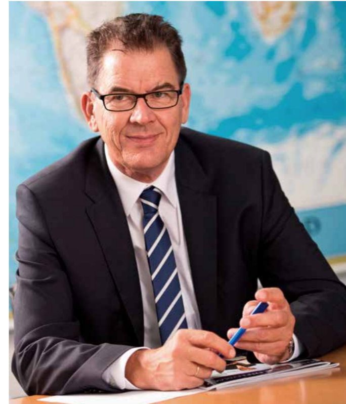
Dr. Gerd Müller ist seit 2013 Bundesminister für wirtschaftliche Zusammenarbeit und Entwicklung

Auch unsere Unternehmen müssen sicherstellen, dass in Lieferketten Menschenrechte eingehalten werden. Viele gehen bereits freiwillig voran. Als Antwort auf die Katastrophe von Rana Plaza etwa initiierte das Bundesministerium für wirtschaftliche Zusammenarbeit und Entwicklung 2014 das Bündnis für nachhaltige Textilien. Gestartet mit