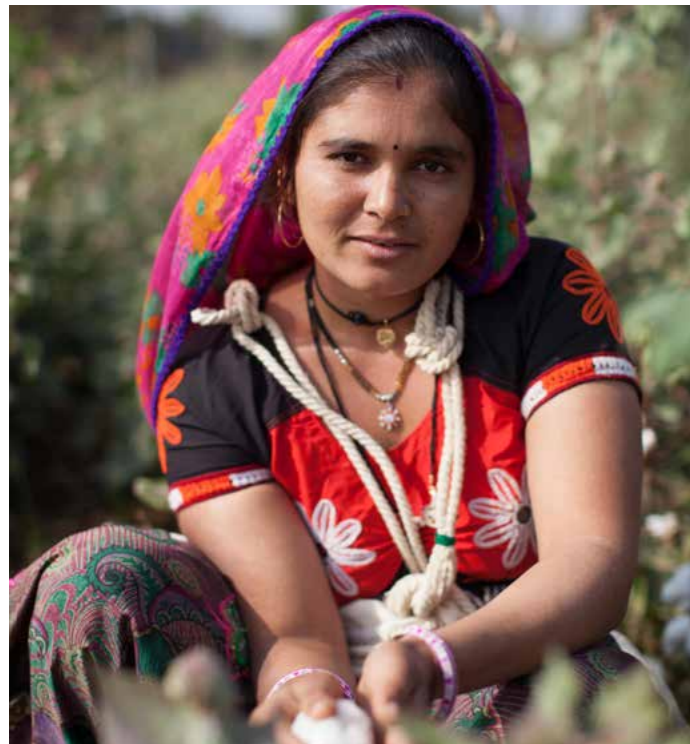
Der Faire Handel verbessert die Arbeitsbedingungen und Einkommenssituation für Frauen

Beginnen wir am Anfang der Produktionskette. Die meisten Baumwollpflücker*innen sind Frauen. Doch je höher die Verarbeitungsstufe, desto niedriger ist ihr Anteil und dementsprechend wenig Erlöse erhalten Frauen aus dem Anbau. Da ihnen in vielen Ländern zudem der Zugang zu Landtiteln und Krediten erschwert wird, ist es Frauen kaum möglich, diese Abhängigkeit zu überwinden und etwa in eigene Felder zu investieren. Somit bietet ihnen der Baumwollanbau wenig Chancen, der Armut zu entkom-