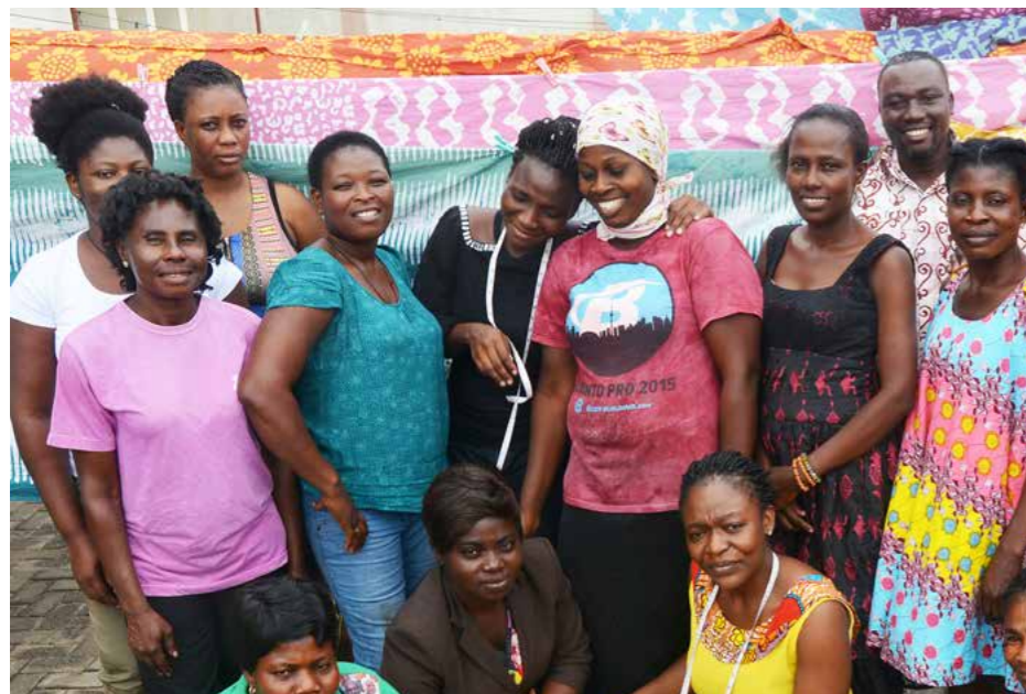
Die Frauen vom Ashaiman Batik- und Nähzentrum strahlen Selbstbewusstsein aus und zeigen, dass ihnen die Arbeit Freude macht.

Der Durchschnittslohn eines Global Mamas Produzenten ist 75 Prozent höher als der ghanaische Mindestlohn und das niedrigste Gehalt eines Geringqualifizierten liegt 83 Prozent über der ghanaischen Armutsgrenze. Global Mamas Produzent*innen verdienen durchschnittlich 34 Prozent mehr als Handwerker*innen sonst in Ghana und haben Zugang zu Sozialversicherung, Krankenversicherung, Überstundenvergütung und bezahltem Mutterschaftsurlaub. Global