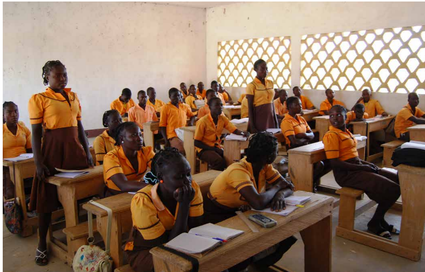
Endlich besuchen auch junge Frauen die Berufsschule in Makandai

Wer fair und nachhaltig produzieren und handeln will, muss einen besonderen Fokus auf Geschlechtergerechtigkeit legen. Dies ist nicht nur ein Gebot der Menschenrechte, sondern eine der zentralen Voraussetzungen für Wirtschaftswachstum und Armutsbekämpfung. Laut einem Bericht der Ernährungs- und Landwirtschaftsorganisation der Vereinten Nationen (FAO) aus dem Jahr 2018 könnten beispielsweise die landwirtschaftlichen Erträge