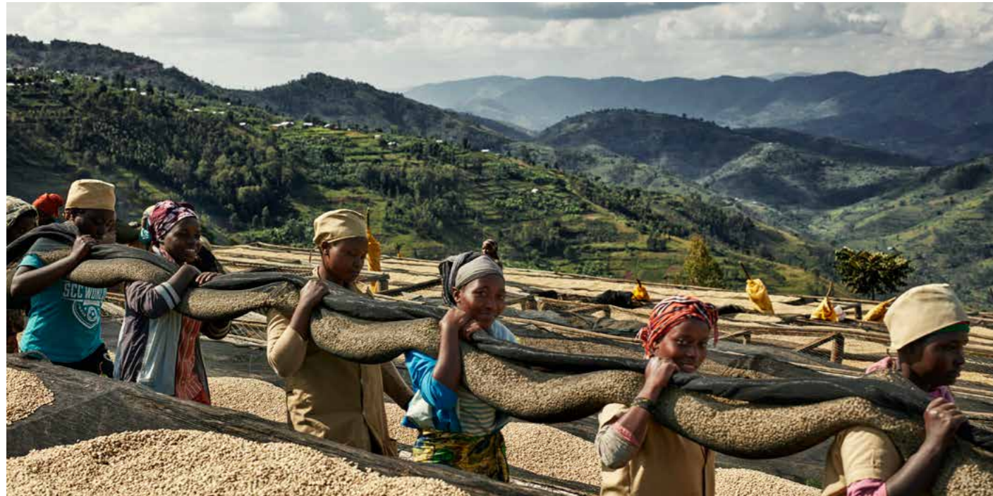
Gleiche Chancen durch Fairen Handel

Gemeinsam für mehr Eigenständigkeit: Die Frauen hinter Angelique’s Finest.