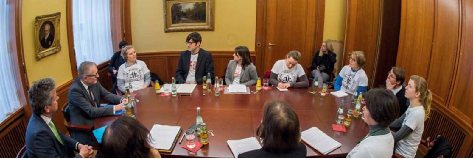
Forum Fairer Handel/Christian Ditsch