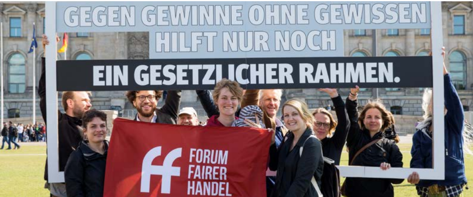
Initiative Lieferkettengesetz/Stéphane Lelarge

gesetzlichen Rahmen (siehe Seite 12 – 13). Die Weltladentags-Kampagne 2020 ist eingebunden in diese kraftvolle Bewegung. Das macht natürlich Mut, den wir an Euch weitergeben möchten.