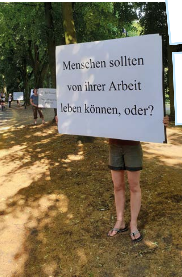
Weltladen im Südviertel

Finden Sie auch? Dann nicken Sie doch mal.